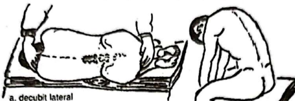
a. decubit lateral

– pregătirea psihică: se informează pacientul cu privire la necesitatea efectuării puncției, i se explică poziția în care va sta